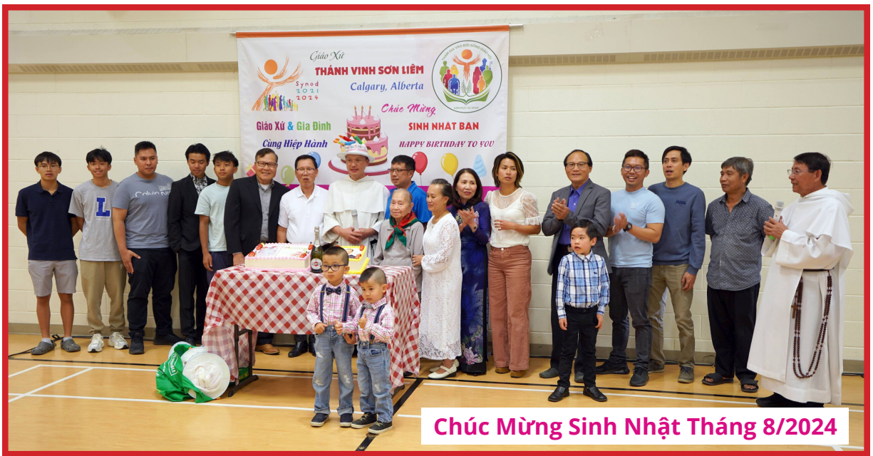
Chúc Mừng Sinh Nhật Tháng 8/2024

của Ngài. Nếu có những điều sơ sót, xin vì lòng mến Chúa yêu Người mà bỏ qua cho.